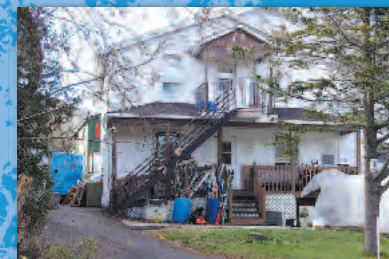
La Maison d'Entraide de Prévost a besoin d'un nouvel espace.

La protection des sentiers est un travail de longue haleine. C'est comme le reste quelqu'un doit faire le travail après en avoir parlé, sinon il ne reste que les paroles.